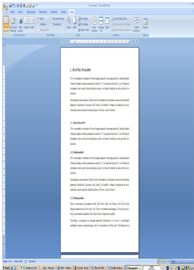
Joonis 1. Pealkirjade ja teksti vormistamine

Pealkirjad peavad vastama jaotise sisule, järele punkti ei panda. Pealkirjades tuleb vältida küsimusi ja hüüdlauseid, samuti ei kasutata ühesõnalisi pealkirju.